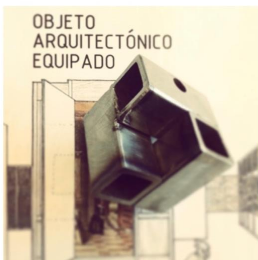
Fig. 3 – Publicación y detalle Escala 1:1 / para un mueble habitable.

Entendemos el equipamiento un dispositivo, una interfase que nos permite imaginar la arquitectura en función de nuevas variables para el alumno, y para la sociedad, maniobrar otras escalas para resolver técnica y tecnológicamente problemas emergentes de sus propias ideas y proyectos.