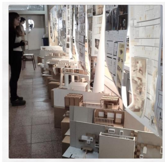
Fig. 2 – Muestra final de trabajos, el mueble habitable.

Muebles modulares, espacios fluidos, vivienda flexible son elementos y estrategias que se desarrollan por influencia de un nuevo tipo de vida, de relaciones sociales más libres.