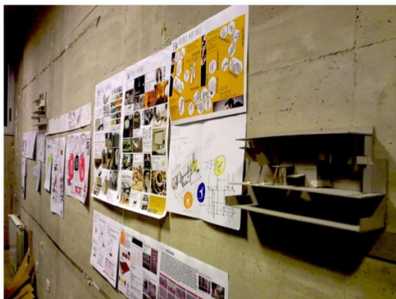
Fig. 1 – Taller de proyecto.

Se trabaja en forma colectiva, es una instancia de verificación de conocimientos que incluyen los vertidos en las unidades temáticas de la asignatura. El alumno opera con un dispositivo, interface o equipo que permite resolver una actividad específica de la temática a desarrollar en el año o en forma articulada con las Arquitecturas del Nivel. Se propone que trabaje con multimaterialidad y las múltiples escalas del proyecto , a los fines de ofrecer una variabilidad exponencial en taller, y construir de esa forma conocimiento colectivo.