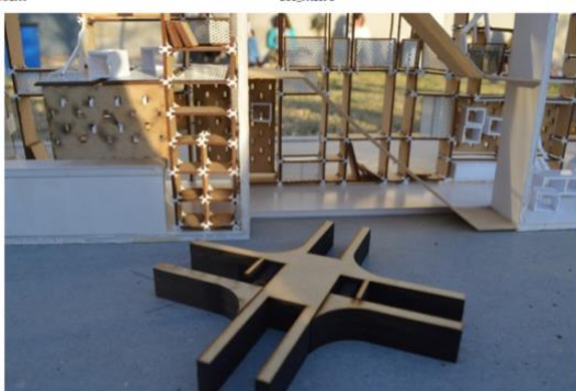
Fig. 3 – Detalle Escala 1:1 / para un mueble habitable.

Siempre con el objetivo de construir la síntesis y el trabajo de MULTIMATERIALIDAD y MULTIESCALARIDAD , donde vamos del territorio al detalle.