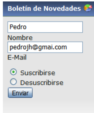
Figura 7. Menús de suscripción al Boletín de Noticias.

Si lo que prefiere es mantenerse actualizado de las novedades del rincón a través de su correo electrónico puede suscribirte al Boletín de Noticias . En la parte inferior de la columna izquierda encontraras el menú para realizar la suscripción; simplemente debes incluir tu nombre y correo electrónico, seleccionar suscribirse y hacer clic en enviar. Cada semana se edita un boletín de novedades que recibirás cómodamente en tu correo electrónico.