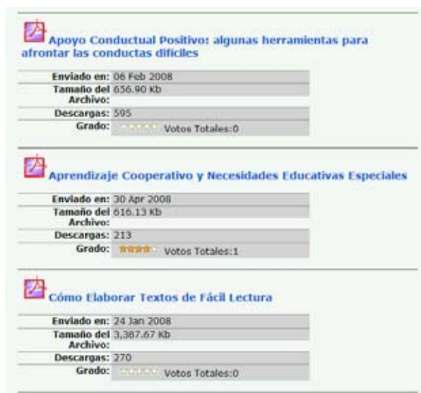
Figura 5. Menú Materiales para Descargar.