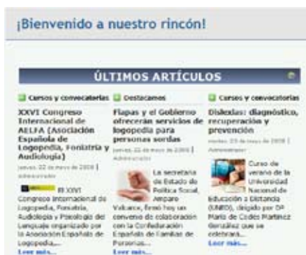
Figura 2. Cuerpo principal de la web.

La sección de Personajes está dedicada a conocer la biografía de personalidades relevantes en el trabajo con discapacitados. Podemos conocer datos relativos a su vida personal y profesional, las obras más destacadas y su relación con determinados síndromes y discapacidades.