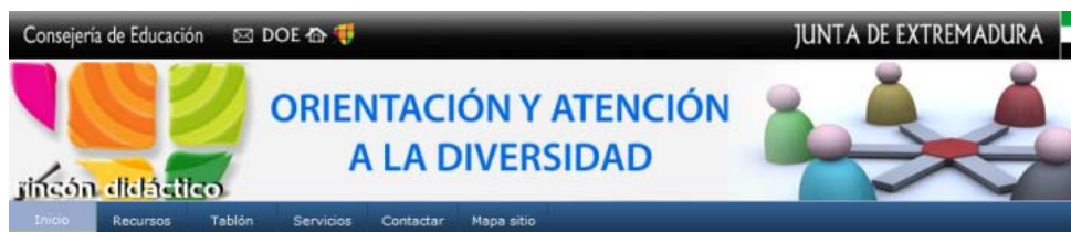
Figura 1. Encabezado del Rincón

El origen de este rincón web parte de la necesidad de muchos profesionales extremeños de encontrar recursos, noticias y eventos de interés, relacionados con el mundo de la atención a la diversidad y que hasta el momento permanecían diseminados por toda la web. Desde hace seis meses intentamos mostrar de forma agrupada todas estas informaciones a través de nuestro rincón. Nos hemos propuesto que lleguen a conocerlo el máximo número de profesionales extremeños, organizando cursos a través de los centros de profesores y recursos de la región. Superada esta fase, es hora de ampliar el perfil de los usuarios y hacernos llegar a una comunidad más amplia. Esta comunicación y el V Congreso de Tecnología Educativa y Atención a la Diversidad constituyen un paso más, hacia la consecución de este objetivo.