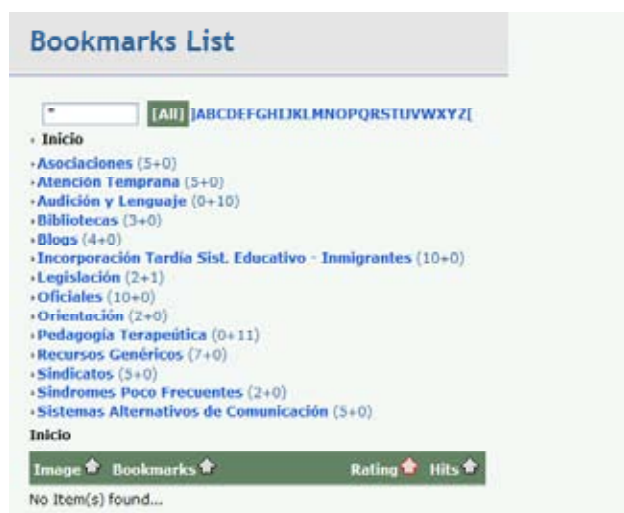
Figura 4. Sección de Recursos on line.

Entre los objetivos más importantes de este Rincón de Orientación y Atención a la Diversidad se encuentra el de ofrecer un conjunto de recursos interactivos que abarquen la mayor parte de las áreas de trabajo en este ámbito del currículo y que tengan un carácter interactivo o documental. En la sección de Recursos on line existe una clasificación de numerosas áreas para agrupar estos recursos, algunos ejemplos son: Atención Temprana, Legislación o Sistemas Alternativos de Comunicación . Estas categorías se dividen a su vez, en otras subcategorías que pretenden facilitar la organización de los recursos, por ejemplo, dentro de Audición y Lenguaje encontramos subcategorías para recursos específicos sobre Discapacidad Auditiva, Estimulación del Lenguaje o Trastornos del Lenguaje Escrito . Una vez que hemos accedido a una de estas subcategorías se puede observar una lista con los recursos clasificados; para acceder a ellos bastará con hacer clic en el título del recurso.