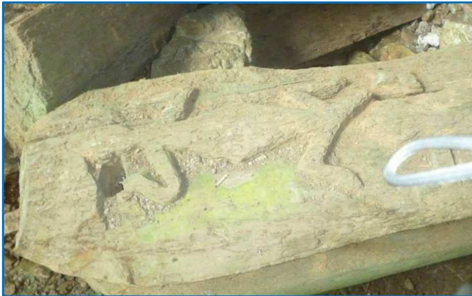
Isang kuhang larawan ng rebyuwer noong Disyembre 26, 2011 sa Yungib ng Sumaguing sa Sagada, lalawigan ng Mountain Province

Sa konsepto naman ng dragon, magkaibang-magkaiba ang paniniwala ng mga Tsino at Pilipino hinggil dito. Kung para sa mga Tsino, ang dragon ay para sa proteksyon samantalang kamalasan o kasamaan naman ito para sa mga katutubong Pilipino. Ito ang nagiging dahilan ng eklipse o paglulon, pagkain, o pagkawala ng mga buwan. Malaki ang pagpapahalaga ng mga katutubong Pilipino sa buwan kung kaya't ito ay kanilang pinangangalagaan sa pamamagitan ng pag-iingay at pagtataboy sa mga lumalamon sa buwan. Madalas itong inilalarawan bilang malaking ahas na may pitong ulo,