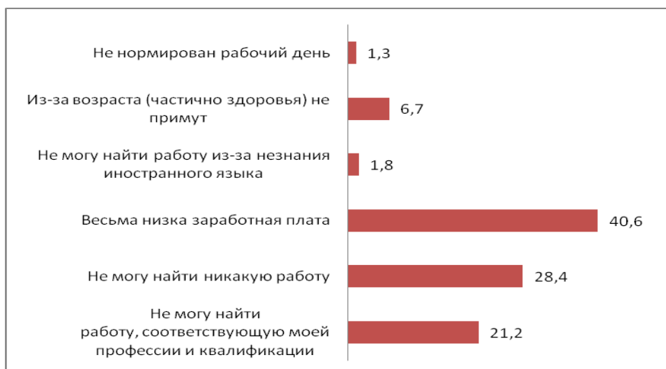
Диаграмма 1. Распределение ответов возвращенных мигрантов на вопрос: “С какими трудностями сталкиваетесь при поиске работы?” (%)

Несмотря на большие усилия, в процессе трудоустройства вернувшиеся сталкиваются с большими трудностями, что сдерживает их занятость (см. Диаграмма 1 ).