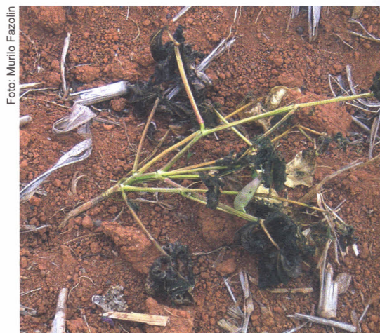
FIGURA 1. Plantas de feijão tombadas pelo ataque de Elasmopalpus lignosellus .

Os adultos, ao se alimentarem das folhas, provocam perfurações nos tecidos (Figura 3), o que reduz a fotossíntese e, conseqüentemente, a produtividade dos feijoeiros (FAZOLIN; ESTRELA, 2003, 2004). A vaquinha pode causar dano na plan-