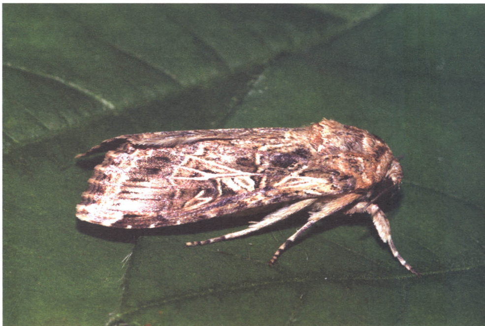
FIGURA 4. Fêmea de Spodoptera cosmioides .

de caupi em terra firme, ocorrem entre a segunda quinzena de agosto e a primeira de setembro (CARNEIRO, 1983).