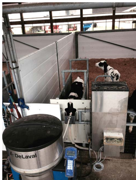
Figura 4. Sistema automático de fornecimento de dieta líquida a bezerros.

Existem diferentes modelos de alimentadores automáticos disponíveis no mercado,