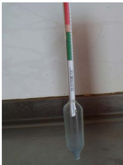
Figura 1. Colostrômetro.

A faixa de temperatura adequada para a avaliação do colostro é de 20 a 25°C. Caso o colostro seja avaliado em temperatura abaixo dessa faixa, a leitura será superestimada e o colostro pode ser erroneamente considerado de alta qualidade. O mesmo pode ocorrer quando a temperatura estiver acima dessa faixa, po-