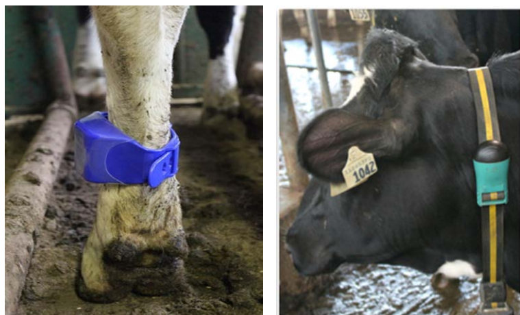
Figura 5. Monitores de atividade física: IceTag (IceRobotics) – esquerda, e colar Heatime (SCR Engineers) – direita.