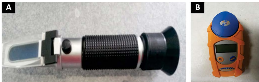
Figura 2. Modelo de refratômetro do tipo BRIX óptico (a) e digital (b).

automáticos é permitir que o tempo fixo destinado para fornecimento da dieta líquida aos bezerros seja mais flexível, já que inúmeros outros trabalhos e obrigações do dia a dia da fazenda estão ocorrendo ao mesmo tempo. Com o uso de alimentadores automáticos, os bezerros podem