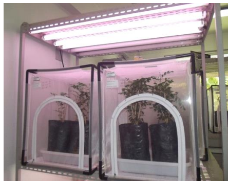
Figura 1. Gaiolas de criação de Diaphorina citri , mantidas no Laboratório de Quarentena “Costa Lima”, da Embrapa Meio Ambiente, em Jaguariúna-SP. Foto: Camila N. Souza, 2015

Os adultos de Diaphorina citri foram obtidos a partir de uma criação estabelecida no Laboratório de Biologia de Insetos da ESALq-USP em Piracicaba-SP. Foram introduzidos 300 adultos de D. citri , no Laboratório de Quarentena “Costa Lima”, da Embrapa Meio Ambiente, em Jaguariúna-SP em 27 de novembro de 2014. Os adultos foram colocados no interior de gaiolas de criação de insetos (45 cm de comprimento, 45 cm de largura e 55 cm de altura), confeccionadas em tela antiáfídica, da marca Lab Creation ® (Figura 1).