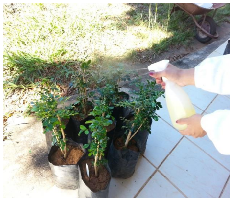
Figura 5. Aplicação da solução de detergente em mudas utilizadas na criação.

Após a utilização dessas mudas, foi feita aplicação pulverizada de solução aquosa com detergente a 10%, e deixou-se agir por 15 minutos; e em seguida lavou-se a muda com água, esse procedimento serve para esterilizar a planta. Depois de 15 dias esta muda será podada para o nascimento de novas brotações e será novamente reutilizada na criação do inseto (Figura 5).