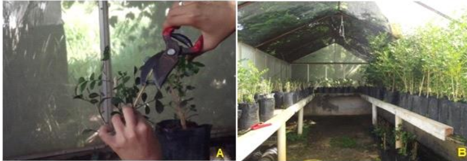
Figura 4. a) Podas das mudas de murtas, realizadas a cada 15 dias para obtenção de brotos novos. b) Mudas de murta, mantidas em telado de “nylon” com temperatura ambiente Foto: Camila N. Souza, 2015

Após a utilização dessas mudas, foi feita aplicação pulverizada de solução aquosa com detergente a 10%, e deixou-se agir por 15 minutos; e em seguida lavou-se a muda com água, esse procedimento serve para esterilizar a planta. Depois de 15 dias esta muda será podada para o nascimento de novas brotações e será novamente reutilizada na criação do inseto (Figura 5).