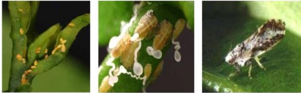
Figura 2. Ciclo de vida de Diaphorina citri , ovos, ninfas e adulto, respectivamente. Foto: Mateus Manara Picoli, 2013. Fonte: http://www.esalq.usp.br/cprural/boaspraticas.php?boa_id=92

Para a coleta dos adultos utilizou-se de um aspirador entomológico manual (FIGURA 3). Após a retirada dos adultos da gaiola, espera-se 15 dias para retirada dos novos adultos. Os novos adultos também foram colocados em outras gaiolas com mudas e brotações novas para começar o ciclo novamente.