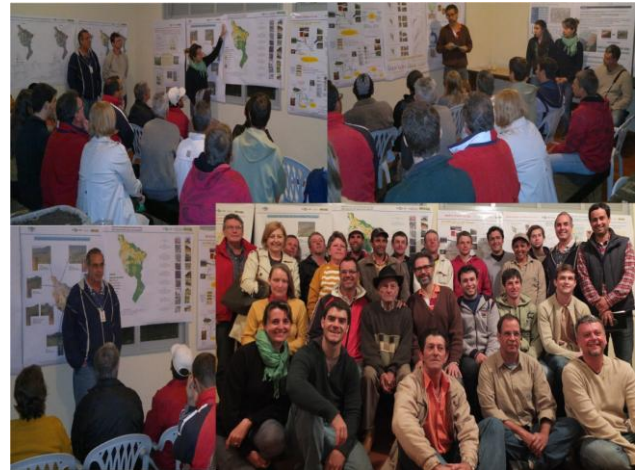
Figura 2: Evento realizado com a comunidade da bacia do Pito Aceso (Bom Jardim, RJ).

Ficou evidente o interesse da comunidade nas apresentações. Muitas perguntas surgiram e houve um processo de assimilação entre a informação científica gerada na área e a realidade das pessoas: as classes de solo, com base em suas características, foram recebendo nomes populares, na maioria das vezes relacionados à aptidão daquele solo para o cultivo agrícola.