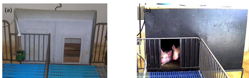
Figura 1. Escamoteadores avaliados - (a) escamoteador de polietileno (largura – 0.94 m, altura – 0.54 m, comprimento -0.65 m e tampa – 0.94 x 0.34 m) - (b) escamoteador de madeira (largura – 0.84 m, altura – 0.61 m, comprimento – 0.69 m e tampa – 0.84 x 0.42 m).

escamoteador de polietileno. As medidas dos escamoteadores de madeira e polietileno estão detalhadas nas Figuras 1 e 2.