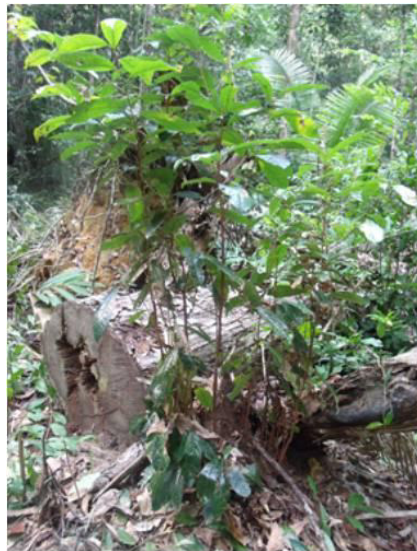
Figura 2. Espécime observado no estudo, com presença de regeneração natural.