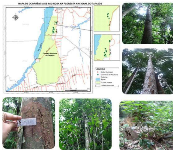
Figura 1. Locais dos 15 espécimes de Pau-Rosa na Floresta Tapajós e imagens feitas pela primeira autora durante o trabalho de campo.

árvores eram abatidas muito próximas ao solo o que inviabiliza o rebroto (ZOGHBI, 2010).