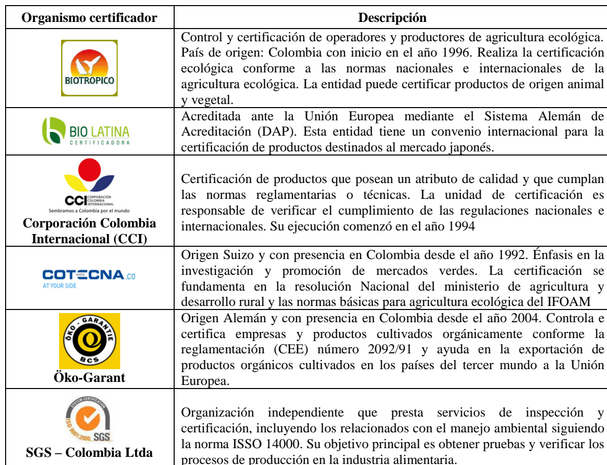
Tabla 1. Certificadoras orgánicas más importantes que operan en Colombia