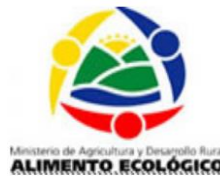
Figura 1. Sello único nacional de alimento ecológico en Colombia

Una vez la entidad certificadora expide el certificado para el producto, se puede iniciar la comercialización del producto bajo la denominación de orgánico, incluyendo la agencia certificadora en la etiqueta. Al obtener la certificación en Colombia es posible solicitar a MADR el “Sello Único Nacional de Alimento Ecológico” (figura 1), que deberá llevar el empaque del producto y que le asegura a los consumidores que el producto que adquieren fue obtenido cumpliendo con los requisitos de la producción orgánica. Este podrá ser utilizado durante 3 años con opción de prórroga. A partir de este punto se deberá inspeccionar anualmente el sistema productivo para renovar la certificación (MADR, 2007)