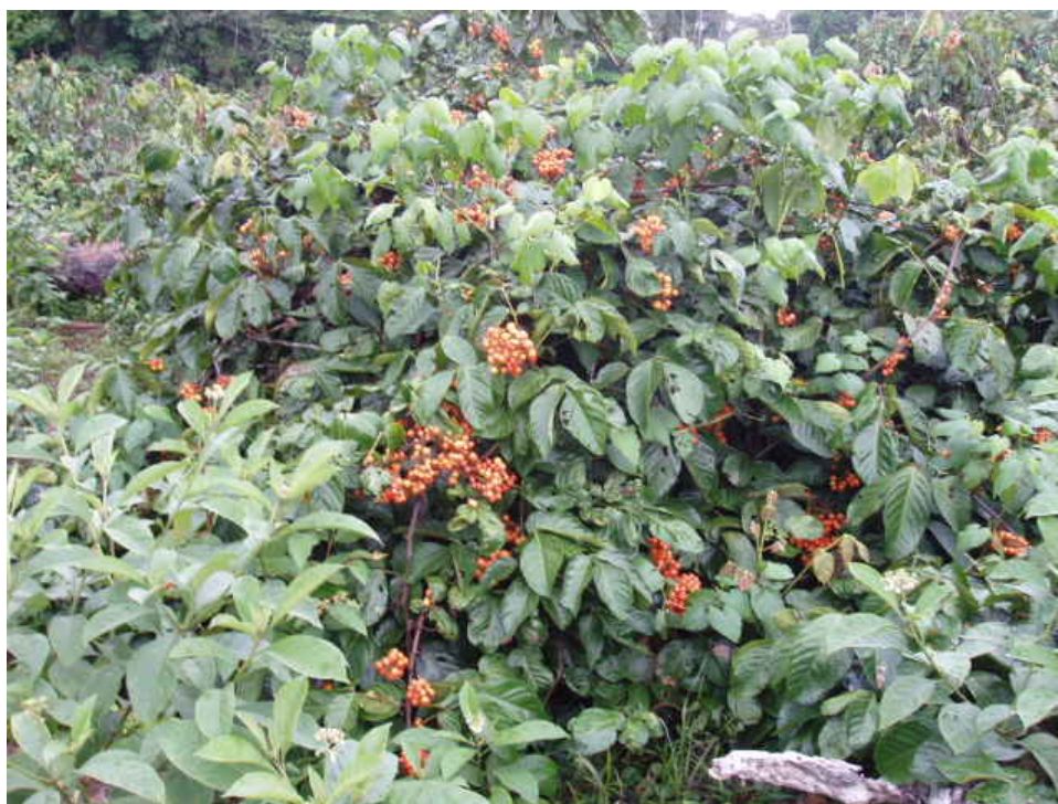
Plantio tradicional do guaraná.

A principal produção da comunidade é o guaraná em relação à área plantada, sendo que a mandioca também tem uma expressividade econômica. Existem também pomares caseiros ao redor de várias residências que fornecem uma boa produção de frutas para o consumo familiar. A área média de cultivo da mandioca está em torno de 2 ha, enquanto que a de guaraná fica ao redor de 3,5 ha.