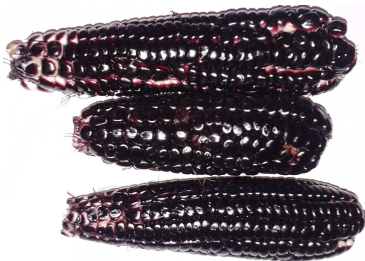
Figura 1- Espigas de milho verde do genótipo TO 002.