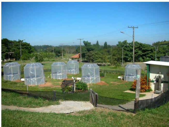
FIGURA 1. Estufas de topo aberto.

Em 19/12/06, foi realizada a semeadura do arroz ( Oryza sativa ), cultivar Agulha Precoce, em cinco sub-parcelas (16x32 cm, 180 sementes por sub-parcela) de cada parcela. Após sete semanas, amostras de solo rizosférico foram coletadas, peneiradas (2 mm) e conduzidas ao laboratório para as avaliações microbiológicas.