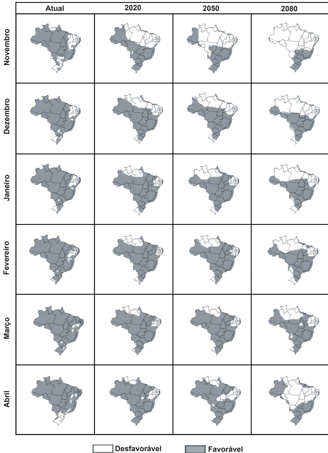
FIG. 3 - Mapa de favorabilidade climática à sigatoka-negra da bananeira no Brasil, para os meses de novembro a abril, no período atual (média de 1961 a 1990) e futuro (2020, 2050 e 2080, para o cenário B2).

cenário B2, resultando em condições menos favoráveis à sigatoka. Além disso, a redução da área favorável à doença é gradativa nas três décadas estudadas para os dois cenários, isto é, a cada década, a área favorável sofre reduções. Por exemplo, no período considerado atual, para os meses de