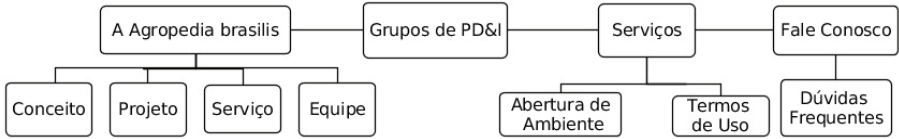
Figura 1. Arquitetura da informação para o site público da Agropedia brasilis