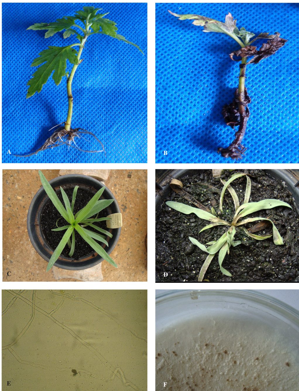
Figura 1. A - Planta sadia de crisântemo Papiro Branco; B – Papiro Branco retirada de um vaso contendo substrato infestado e que teve o sistema radicular podado e o colo ferido, apresentando os sintomas de Rhizoctonia sp. no seu sistema radicular, no colo e sintomas reflexos, na parte aérea; C - Planta de gipsófila normal e sadia; D - Planta de gipsófila apresentando sintomas de Rhizoctonia sp. nas folhas; E - Hifa do isolado de Rhizoctonia sp. de crisântemo; F - Colônia do isolado de Rhizoctonia sp. de gipsófila, crescido em meio de batata-dextrose-ágar.

Na Itália, o fungo R. solani AG-4 foi descrito em crisântemo e em outras ornamentais (8). No Estado do Pará/Brasil há relato de ocorrência de Tanatephorus cucumeris , fase perfeita de R. solani , em Chrysanthemum indicus (7). Assim, reporta-se pela primeira vez R. solani AG-4 HG I em crisântemo de vaso, causando patogenicidade nas cultivares Papiro Branco e Amarelo, no Estado de São Paulo, Brasil, sendo essa doença importante, principalmente, na fase de enraizamento dos materiais.