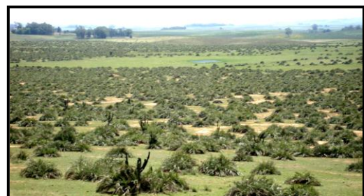
Figura 02: Fotografia expondo ao centro a pequena Lagoa Vermelha, localizada no topo de uma colina de arenito em meio a um palmar de butiá-anão ( Butia lallemantii Deble & Marchiori-Arecaceae)-Bacia Hidrográfica do Arroio Lageado Grande (ALVES, F. S., 2008).