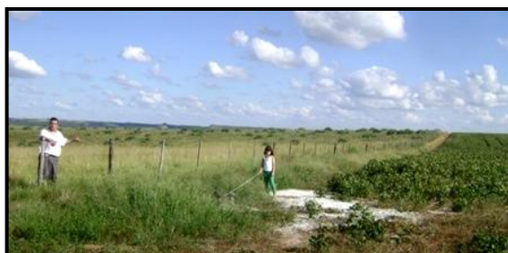
Figura 03: Fotografia expondo o processo de fragmentação dos butiazais em virtude da lavoura de soja. (RODRIGUES, P. R. F. 2011).

Por tratar-se de uma espécie autóctone, é importante viabilizar estudos que venham a avaliar possibilidades de agregação de valor ao butiá-anão, além do consumo in natura do fruto, o uso das fibras das folhas em artesanato, dos frutos para produção de sucos e geléias, avaliação das propriedades medicinais do fruto, uso ornamental e paisagístico da espécie, permitindo o incremento da renda na agricultura familiar da região.