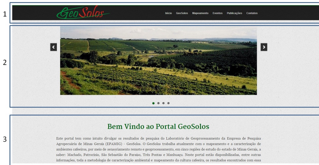
Fig. 4. Página principal do site GeoSolos

O acesso ao site está disponível no link http://epamig.ufla.br/geosolos/ . A página principal do site GeoSolos está organizada em três partes, como mostra a figura 4, a seguir, 1) Barra horizontal superior contendo seis hiperlinks para acesso à nossa equipe, com fotos e Currículo Lattes de todas as pesquisadoras e todos os bolsistas integrantes do laboratório; ao Mapeamento contendo as áreas-piloto selecionadas dentre as principais regiões produtoras de café em Minas Gerais; Eventos tais como congressos nacionais e internacionais na área de geoprocessamento; Publicações realizadas pela equipe desde 1998; e Contatos onde oferecemos um canal de comunicação para o envio de dúvidas, sugestões, comentários, críticas e elogios por meio de formulário ou redes sociais. 2) Caixa de Slides: com imagens dinâmicas possibilitando a visualização dos principais acontecimentos, imagens das áreas mapeadas, eventos e notícias referentes ao geoprocessamento. 3) Corpo do site: onde se encontra o conteúdo de cada página incluindo mapas interativos