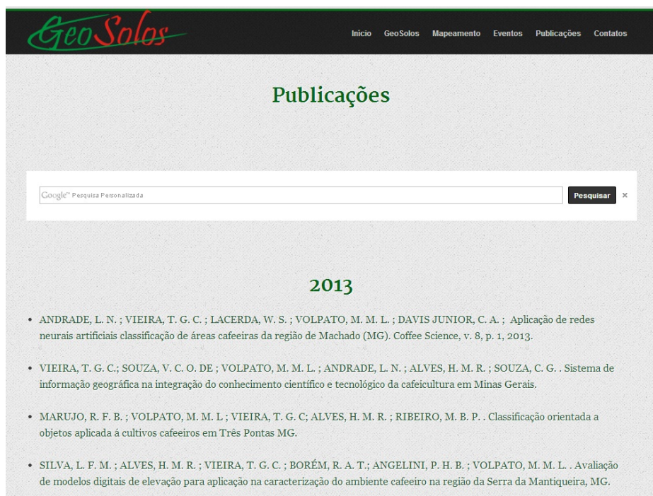
Fig. 5. Página de publicações e barra de busca personalizada

A página de Publicações do site GeoSolos conta com uma barra de buscas personalizada auxiliando nas pesquisas entre artigos, teses e dissertações realizadas pela equipe desde 1998 como mostra a figura 5