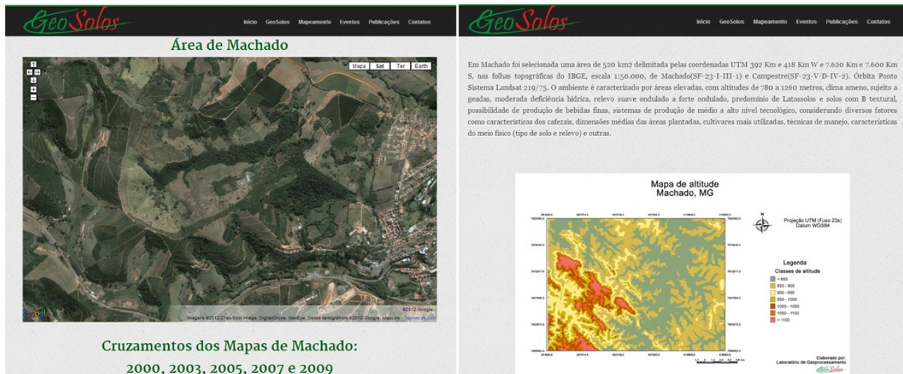
Fig. 6. Exemplos de mapa dinâmico e mapa temático do site

A página Mapeamento do site GeoSolos contém links direcionados as áreas-piloto, com mapas temáticos, mapas dinâmicos e cruzamentos como mostra a figura 6. As áreas-piloto foram selecionadas a partir de investigações prévias sobre as áreas de cafeicultura que mais representassem as regiões produtoras em questão. Foram selecionadas, dentre as principais regiões produtoras de Minas Gerais, a região Sul de Minas, a região do Alto Paranaíba e a região da Zona da Mata. A região Sul de Minas foi dividida em três sub-regiões, em função das diferenças do ambiente e da atividade cafeeira, elegendo-se os municípios de Machado, São Sebastião do Paraíso e Três Pontas como representativos destas sub-regiões.