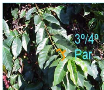
Figura 2. Localização do terceiro e quarto par de folhas, utilizados nas coletas para identificação de doenças e pragas.