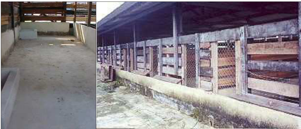
Figura 1: Vistas interna e externa das baias experimentais

Os experimentos de nutrição com a coleta de dados de desempenho dos animais foram realizados nas dependências da Embrapa Amazônia Oriental, Belém – PA, em 12 baias experimentais de 2m X 6m, onde foi introduzido 1 animal em cada baia. Cada baia tinha uma fonte de água permanente ou bebedouros e um comedouro permitindo o livre acesso dos animais à alimentação (Figura 1).