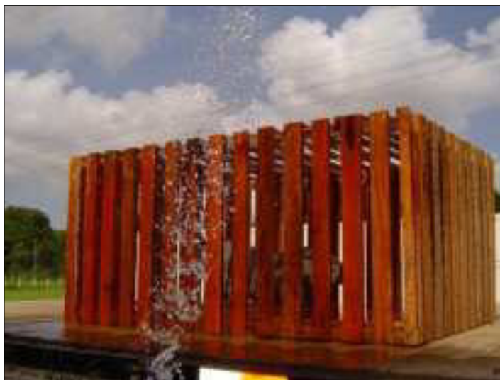
Figura 2: Gaiola de transporte para caititus

como eram animais silvestres houve a necessidade de cuidados especiais como a aquisição de licença para o transporte e abate, a construção de gaiolas em madeira (Figura 2), a escolha do horário no início da manhã e a diminuição do stress através do resfriamento dos animais com jatos de água minimizando os efeitos do calor (Figura 2).