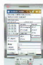
Figura 3 - Janela para edição da área de um talhão