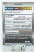
Figura 1 - Tela inicial do programa

Potencial Matricial: 60 cm 100 cm 330 cm 600 cm 1000 cm 15000 cm