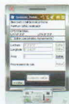
Figura 2 - Janela para cadastramento de talhões