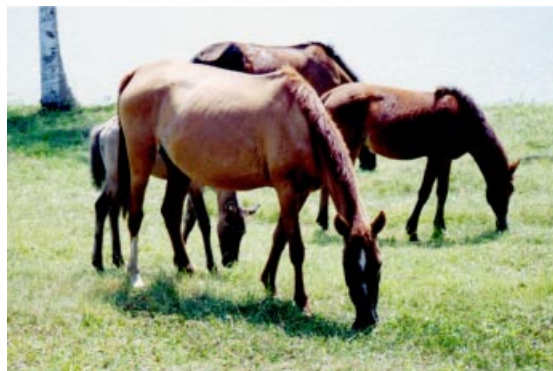
Figura 1. Animais da raça Marajoara do BAGAM - Embrapa Amazônia Oriental