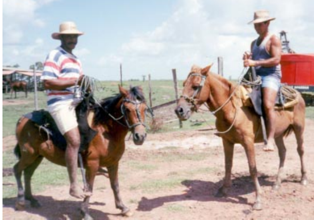
Figura 2. Mini-cavalos da raça Puruca – Faz. Paraíso – Retiro Grande – Marajó

O cavalo Mangalarga é tipicamente brasileiro e surgiu há cerca de 200 anos na Comarca do Rio das Mortes, no Sul de Minas Gerais, através do cruzamento de cavalos da raça Alter trazidos da Coudelaria de Alter do Chão, em Portugal, com outros cavalos selecionados pelos criadores daquela região mineira. Tem como função principal a marcha, que é distinta das outras encontradas nos demais marchadores do mundo. É de temperamento ativo e dócil e sua rusticidade é observada, também, na facilidade de adaptação a quaisquer terrenos e climas como o tropical, o tempera-