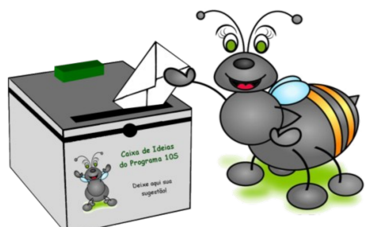
Figura 1 – Modelo da caixa de sugestões

O Banco de Ideias/Caixa de Sugestões foi divulgado na Unidade no evento de Lançamento do Programa 10S. A princípio, foram disponibilizadas 10 caixas (Figura 1) distribuídas em vários locais na Unidade. Formulários específicos (figura 2) foram desenvolvidos para o registro da sugestão/ideia. Também foi desenvolvido um sistema informatizado visando facilitar o registro da ideia, sugestão ou reclamação. Em 2010 o Canteiro de Ideias implantado pela então ACS foi incorporado ao Programa 10S da Embrapa Suínos e Aves.