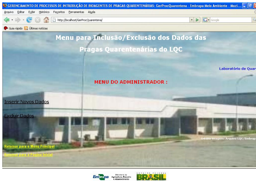
FIGURA 8. Menu do administrador (inclusão/exclusão de dados)

Por meio das opções o administrador tem acesso as páginas para a inclusão e exclusão de dados do Banco de Dados. Parte desses recursos são apresentados nas Figuras 8 a 10.