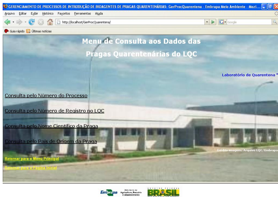
FIGURA 5. Menu de consultas