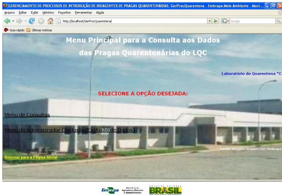
FIGURA 4. Menú principal