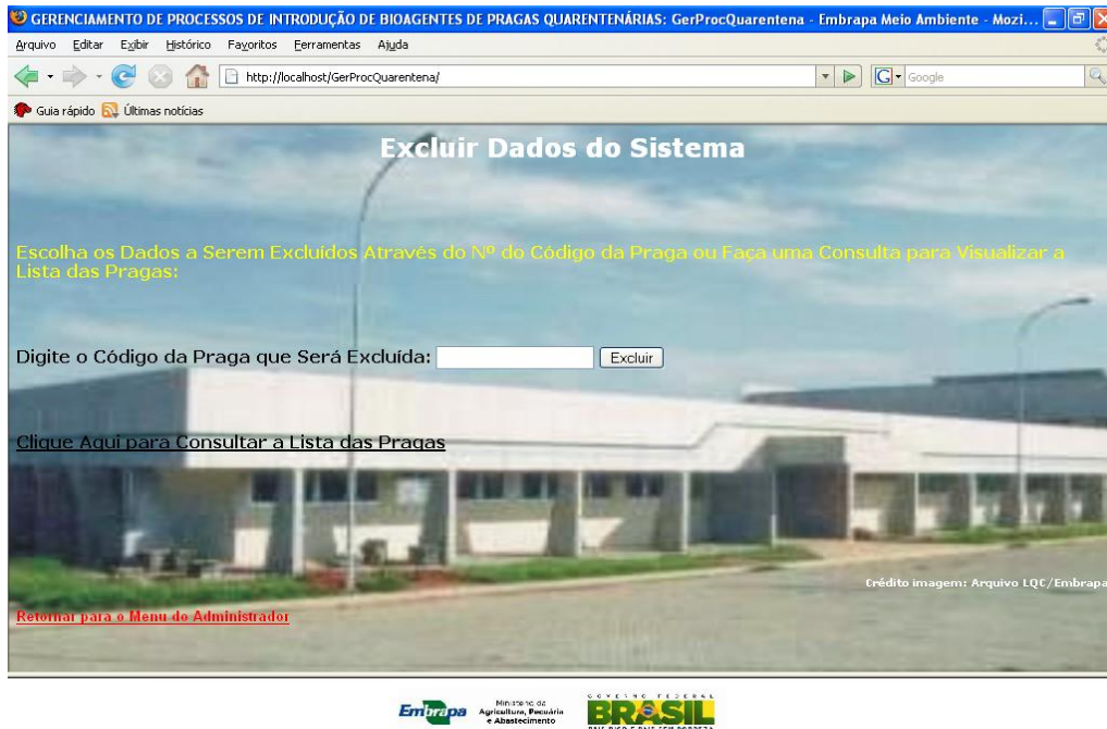
FIGURA 10. Opção para excluir dados do Banco de Dados do sistema