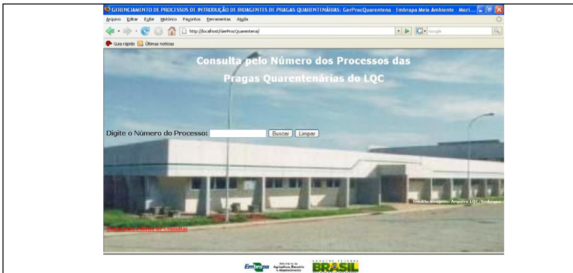
FIGURA 6. Consulta pelo N° do processo