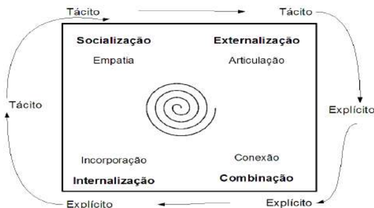
Figura 1: Processo SECI e a espiral do conhecimento. (Nonaka et al , 2000)

O conhecimento é gerado por intermédio de cada um dos quatro modos de conversão (SECI), e o conhecimento gerado interage na espiral de criação de conhecimento, conforme a Figura 1.