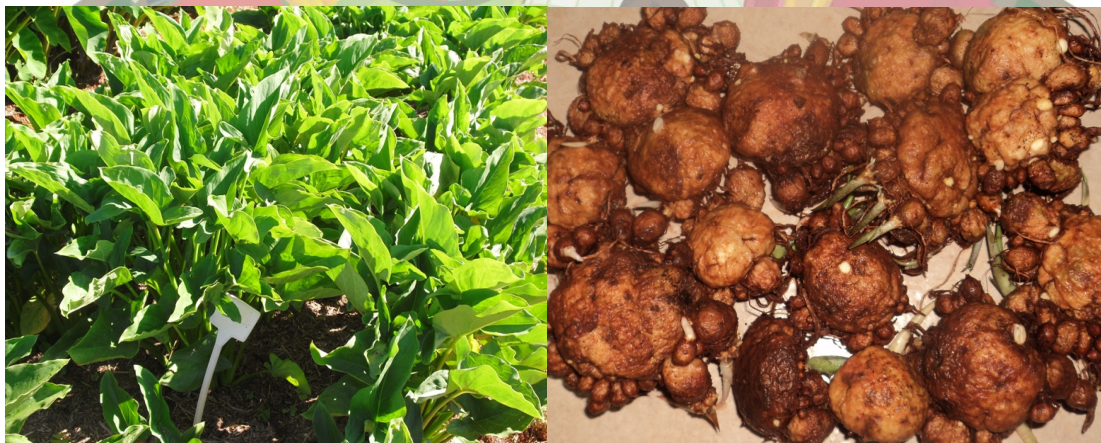
Figura 2: Plantas de mangarito e rizomas colhidos do acesso CNPH 177 na parcela experimental. (Mangarito plants and rhizomes harvested from CNPH 177 accession an experimental plot). Brasília, DF, 2011.