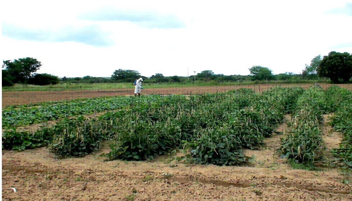
Figura 1: Visão geral do experimento em campo contendo as gerações F 1 e F 2 , os retrocruzamentos RC 1 e RC 2 e os parentais BRS Carijó e BR14 Mulato. (Overview of the field experiment containing F 1 and F 2 generations, the RC 1 and RC 2 backcross and BRS Carijó and BR14 Mulato parentals.)

Tabela 1. Estimativa do coeficiente de correlação fenotípica entre os caracteres dias para maturação de vagem (DPM), comprimento do ramo principal (CRP), comprimento do ramo secundário (CRS), número de ramos secundários (NRS), número de nós do ramo principal (NOS) e peso de grãos (PG) nas populações F 2 , RC 1 e RC 2 do cruzamento entre BRS Carijó e BR14 Mulato. (Estimates of phenotypic correlation coefficient between the characters days to maturity (DPM), main branch length (CRP), length of the secondary branch (CRS), branch number (NRS), number of main branch node (NOS) and grain weight (PG) in F 2 , BC 1 and BC 2 populations of the cross between BRS Carijó Mulato and BR14). Petrolina, PE, 2011.