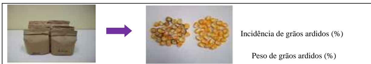
Figura 1. Quantificação dos grãos ardidos

Amostras de milho colhido no campo (500 a 1000g de cada parcela) foram encaminhadas para o Laboratório de Fitopatologia (Laboratório de grãos armazenados), separadas visualmente e analisadas para identificação e quantificação de grãos ardidos (Figura 1). Baseado no número total de grãos e no peso total de grãos da amostra calcula-se a porcentagem em número de grãos ardidos (NGA) e peso de grãos ardidos (PGA) por amostra.