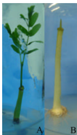
Figura 1 – Plântulas oriundas de embriões zigóticos de paricá cultivados em meio MS contendo as concentrações dos sais reduzidas à metade, sem adição de regulador de crescimento (A) e com suplementação de AG 3 (B). Embrapa Amazônia Oriental, Belém-PA, 2007.

Médias seguidas por letras distintas entre si comparam os tratamentos, ao nível de 5% de probabilidade pelo Teste de Tukey. MS: meio de cultura Murashige & Skoog; AC: ácido cítrico; AG 3 : ácido giberélico.