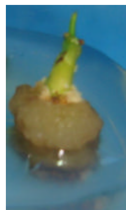
Figura 4 – Plântula oriunda de embrião zigótico de paricá inoculado em meio ½ MS suplementado com 1mg.L -1 de BAP com formação de calos de coloração bege. Embrapa Amazônia Oriental, Belém-PA, 2007.