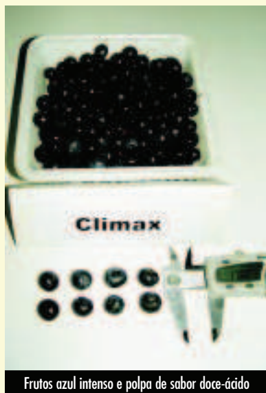
Frutos azul intenso e polpa de sabor doce-ácido

As informações estatísticas sobre o mirtilo no Brasil são ainda escassas. Porém, considerando-se áreas com plantios de três anos ou mais (plantas em produção), estima-se que a área cultivada atualmente no Brasil seja de 27 hectares, dos quais cerca de 48% são de “highbush” e 52%, de “rabbiteye”. Desta área cultivada, 75% encontra-se no Rio Grande do Sul, especialmente na região de Vacaria. Pode-se afirmar que o Brasil