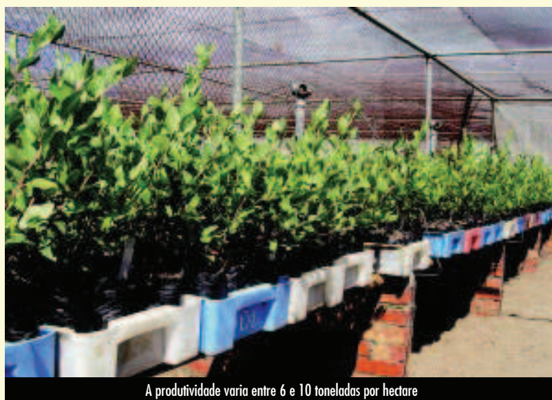
A produtividade varia entre 6 e 10 toneladas por hectare