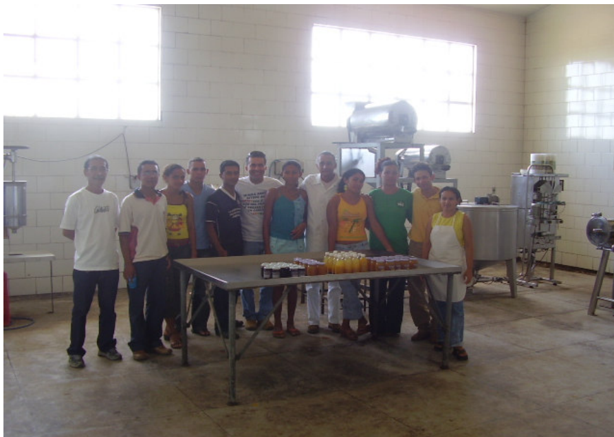
Figura 2 – Participantes e instrutor no curso de Boas Práticas realizado em Marabá-PA.

Entre estas informações foram socializadas técnicas de análises para o controle de qualidade dos produtos, tais como: controle de acidez total, Brix (teor em açúcares) e temperaturas durante o processamento e o armazenamento. Boas Práticas de Fabricação asseguram tanto a qualidade dos produtos como as condições de trabalho que assim atendem aos padrões sanitários exigidos pelo Ministério da Agricultura o que garante uma maior confiabilidade na relação com compradores, órgãos de inspeção e outros agentes locais.