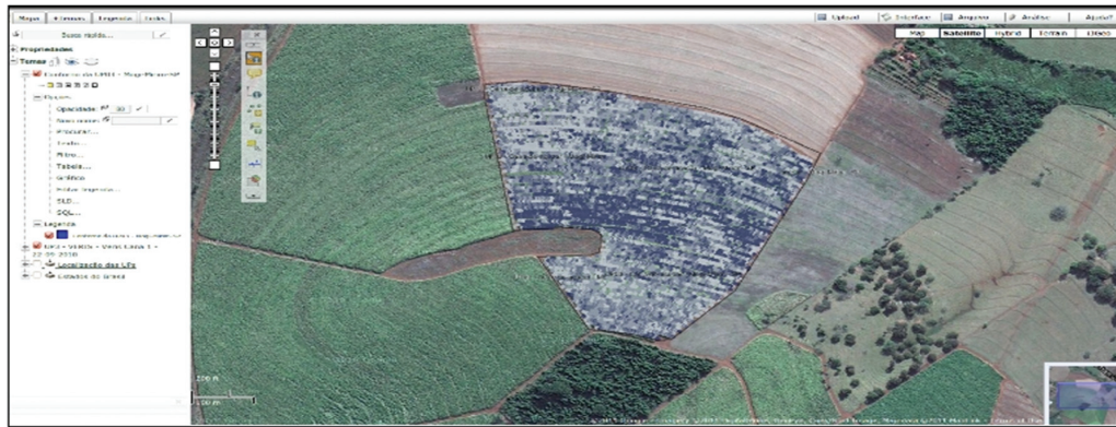
Figura 3. Visualização de dados de condutividade elétrica do solo no repositório da Rede AP.