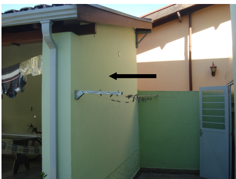
FIGURA 2: Parede, suporte para o instrumento.

Além disto, nesta área se encontra a parede onde o instrumento irá ser construído (Figura 2), juntamente com o telhado (Figura 3) que servirá de suporte para drenar a chuva até as calhas, direto ao sistema de armazenamento, possuindo uma área de aproximadamente 58,82 m 2 .