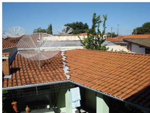
FIGURA 3: Telhado suporte, para a o direcionamento, do fluxo hídrico.