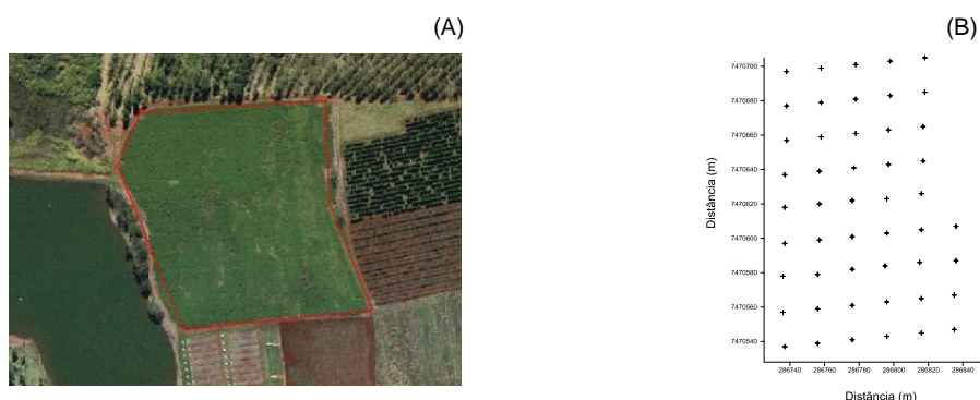
FIGURA 1. Área experimental do Instituto Agrônomo de Campinas (IAC), SP: (A) foto aérea de 2006; (B) grade de amostragem com 50 pontos.

Os dados foram obtidos por meio de amostragem em 50 pontos georreferenciados numa grade amostral regular, conforme a Figura 1.