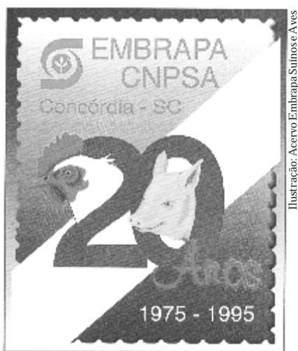
Ilustração: Acervo Embrapa Suínos e Aves