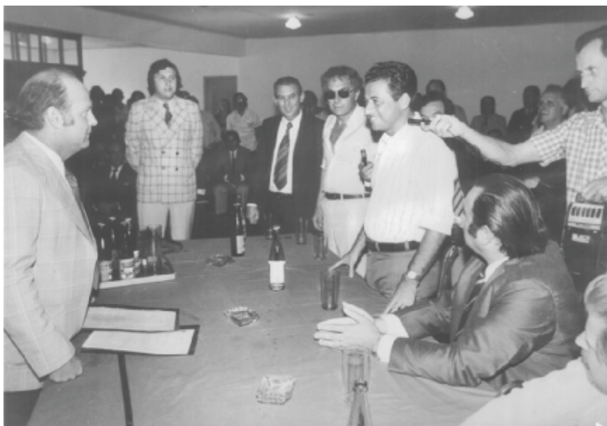
Figura 1. Ministro Alysso Paulinelli, ao centro de camisa branca, em pé, recebeu pedido de criação da Embrapa Suínos e Aves em reunião na ACCS. Dois meses após a visita a Concórdia, o ministro confirmou a instalação da Embrapa no município