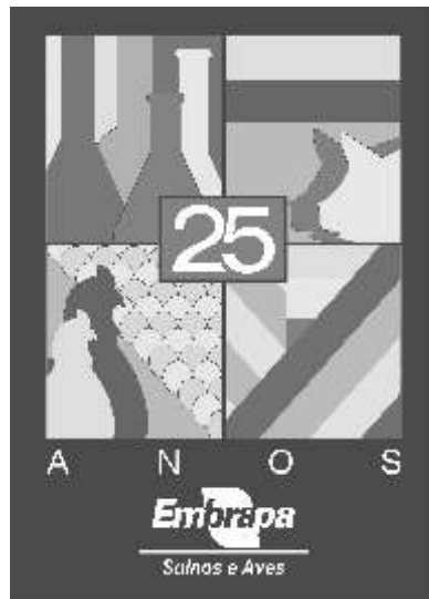
Ilustração: Acervo Embrapa Suínos e Aves