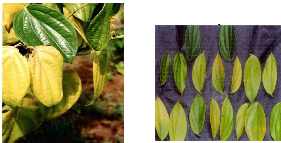
Fig. 1. Folhas de pimenteira-do-reino apresentando intensidade progressiva de sintomas de deficiência de nitrogênio em comparação com folhas sem sintomas