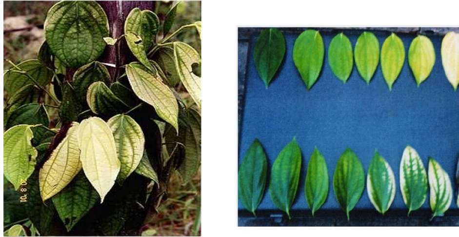
Fig. 2. Folhas de pimenteira-do-reino apresentando intensidade progressiva de sintomas de deficiência de manganês comparadas com folhas sem sintomas