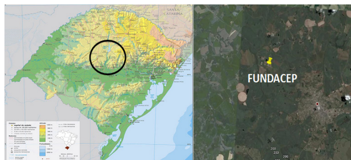
Figura 1. Localização do sítio experimental no município de Cruz Alta, no Estado do Rio Grande do Sul.

MATERIAL E MÉTODOS: O sítio experimental considerado foi o da FUNDACEP (Fundação Centro de Experimentação e Pesquisa Fecotrigo) cujas coordenadas geográficas são 28°36' S e 53°40' O; e altitude 409 m, localizado no município de Cruz Alta, no Estado do Rio Grande do Sul, conforme indicação em destaque na Figura 1 . Para análise do desempenho do modelo CABLE em simular o saldo de radiação foram selecionados os dias 10, 11 e 12 de fevereiro representativos do estágio reprodutivo da cultura da soja.