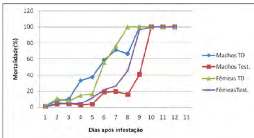
Figura 1. Porcentagem de mortalidade de machos e fêmeas de Z. subfasciatus logo após o tratamento dos grãos de feijão com Terra de Diatomácea.

A terra diatomácea demonstrou ser eficiente em todos os tratamentos quando comparado com a testemunha. Logo após o tratamento dos grãos com terra de diatomácea foi observado 100% de mortalidade das fêmeas, no oitavo dia após infestação dos grãos com os adultos ( Figura 1). Lorini et al. (2001) observaram que a terra diatomácea não provoca a mortalidade imediata do caruncho do feijão, Acanthocelides obtectus , sendo que a morte pode ocorrer em um período variável de um a sete dias. Após 30 e 60 dias do tratamento dos grãos, a terra de diatomácea não perdeu a eficiência , matando mais rapidamente os carunchos em relação a testemunha (Figuras 2 e 3). Melo et al (2008) comparando a eficiência de pós inertes e inseticidas químicos no controle de pragas de grãos armazenados, verificaram que os produtos compostos por terra de diatomácea usualmente necessitam de um tempo um pouco maior para matar os insetos, quando comparado com os inseticidas que agem por contato. Entretanto, o efeito residual da terra de diatomácea foi normalmente maior. Estudos realizados por Canepelle (2003) demonstraram que a terra de diatomácea causou até 50% de mortalidade da população de Ephestia spp. em milho por um período de 210 dias.