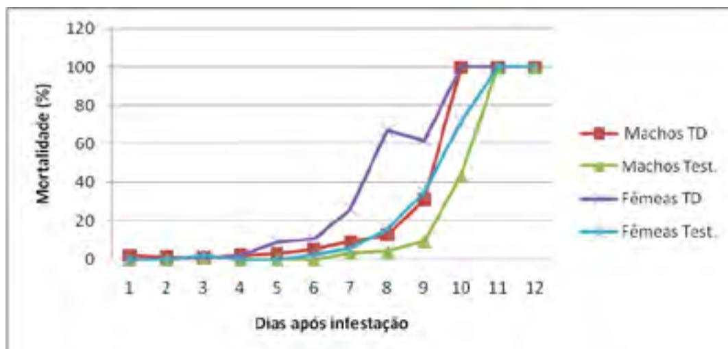
Figura 2. Porcentagem de mortalidade de machos e fêmeas de Z. subfasciatus , 30 dias após o tratamento dos grãos de feijão com Terra de Diatomácea.