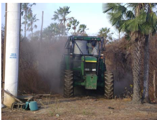
Foto 1 - Corte seletivo da caatinga

Nesse contexto foi realizado um corte seletivo da caatinga (Foto 4), por meio do equipamento “Tipitamba” que na língua dos índios Tiriyó, do norte do Estado do Pará, quer dizer ex-roça ou capoeira. Esse equipamento foi desenvolvido pela Embrapa Amazônia Oriental em conjunto com Universidades alemãs de Göttingen e Bonn, por meio de convênio de cooperação internacional, que visa desenvolver novas alternativas de cultivo sem a utilização do fogo por meio do manejo da vegetação secundária em descanso. O preparo de área via derruba-e-queima, é a prática mais usual local pelos agricultores familiares, que por sua vez é substituído pelo corte e trituração mecanizada da capoeira, que passa a ser utilizada como cobertura morta do solo para os cultivos em plantio direto, permanecendo nos módulos dezenas de carnaúbas (Foto 4), planta típica do nordeste brasileiro, predominando nos Estados do Ceará, Piauí e Rio Grande do Norte.