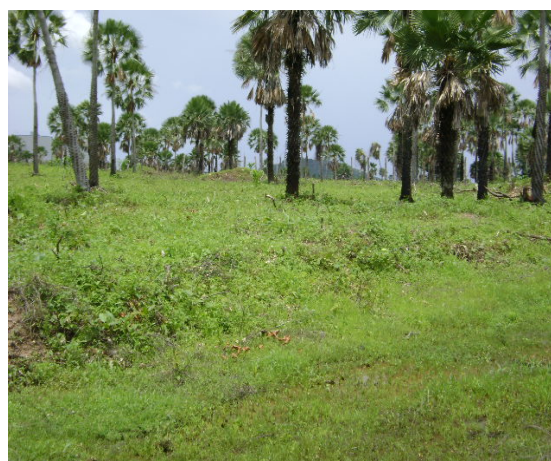
Foto 2 - Preservação das carnaúbas

Assim foi preservando um corredor agroecológico, os limites das quatro propriedades foram arborizados com o Neen ( Azadirachta Indica ), planta indiana em espaçamento 2 x 2 servindo como quebra vento e fornecedor de insumos para confecção de inseticidas