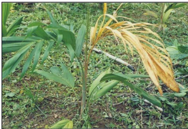
FIG. 1 - Planta de pupunha ( Bactris gasipaes ) com sintoma marcador – amarelecimento da folha bandeira causada por Phytophthora palmivora .