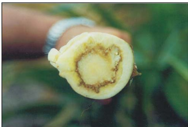
FIG. 2 - Corte transversal na base do estipe de planta de pupunha ( Bactris gasipaes ) com escurecimento dos tecidos internos.

estudo foi pareado em meio CA, com isolados padrões pertencentes aos grupos de compatibilidade A1 e A2 de Phytophthora capsici Leonian, distanciados a 3 cm um do outro. As placas foram incubadas no escuro contínuo, em temperatura ambiente, por quatro dias. Após esse período, avaliou-se a formação de oósporos na região de contato entre o micélio das duas culturas. A testemunha constituiu-se de dois discos do mesmo isolado em cada placa.