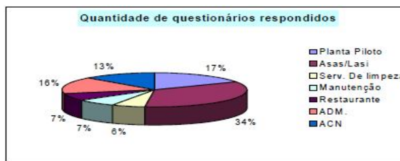
Figura 1. Quantidade de questionários respondidos por setor.

pilotos, para que juntos com a Comissão de Melhoria de Processos da empresa realizassem ajustes nos seus respectivos processos.