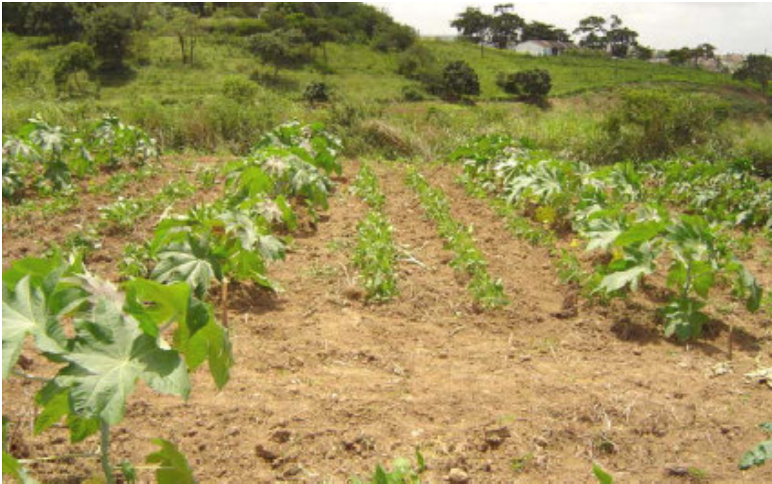
Figura 1. Vista da área experimental aos 60 dias após o plantio, Vitória de Santo Antão-PE.

O presente trabalho foi instalado no Campo Experimental da Empresa Pernambucana de Pesquisa Agropecuária - IPA, (Figura 1), município de Vitória de Santo Antão-PE, (08°08' S e 35°22' W a 146m de altitude) com precipitação pluviométrica média anual de 1834mm, concentrada no período de abril a julho, e temperatura média de 27,1°C. O plantio foi feito em 10 de julho de 2005, sendo registrados, durante o ciclo da cultura, 273mm de chuva concentrados nos meses de julho e agosto.