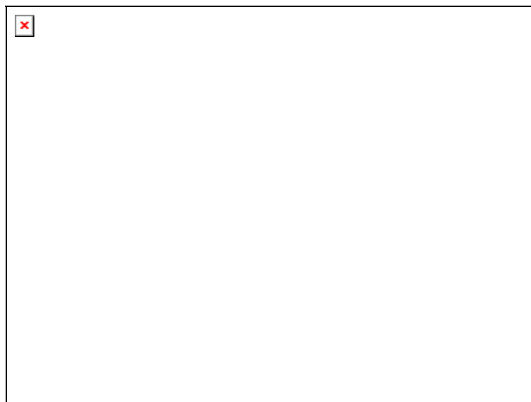
Fig. 2 Taxa de conversão de explantes em calos a partir de hipocótilos de mamoeiro. A= 4% sacarose + 0 (controle) 2,4D; B= 4% sacarose + 7,5 mg/ml de 2,4D; C= 4% sacarose + 10 mg/ml 2,4D; D= 4% sacarose + 15 mg/ml 2,4D; E= 5% sacarose + 0 (controle) 2,4D; F 5% sacarose + 7,5 mg/ml de 2,4D;

O peso fresco médio dos calos após 112 dias de cultura foram maiores nos meios B, C e D, na concentração 4% de sacarose e 2,4-D a 7,5; 10 e 15 mg/ml). Portanto, os melhores meios para formação e desenvolvimento dos calos foram B, C e D( Fig.3).