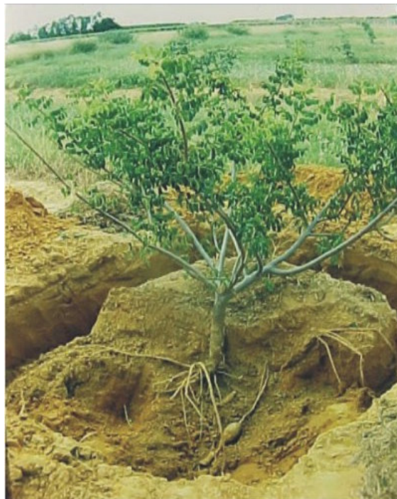
Figura 1 Formação de xilopódio em plantas matrizes de umbu gigante.