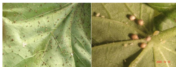
Figura 3. Colônias de pulgões, Aphis gossypii , parasitadas em condições de casa-de-vegetação

local e influenciada pelo ambiente de criação, ainda mais que o controle do parasitismo é eficaz quando a criação é submetida a condições de laboratório.