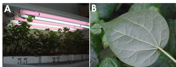
Figura 2. (A) Telado para manutenção da criação dos pulgões Aphis gossypii e (B) colônias dos pulgões em condições de laboratório, 20 dias após a emergência.

A criação dos pulgões deve ser mantida em laboratório e realizada em estrutura e condições semelhantes daquelas citadas anteriormente. Inicialmente as plantas de algodoeiro já desenvolvidas e com até vinte dias de emergência, devem ser transferidas para os telados de criação. A criação deve ser iniciada com colônias de A. gossypii coletados em plantas de algodoeiro, que foram posteriormente transferidas e infestadas plantas mantidas no telado de laboratório em salas protegidas, para evitar a migração e infestação de outras espécies de pulgões e de inimigos naturais. Em intervalos de vinte dias, as colônias dos pulgões foram transferidas para novas plantas (Figura 2).