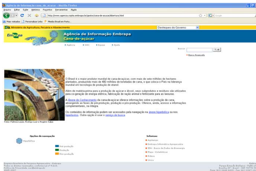
Figura 2 - Agência de Informação da Cana-de-açúcar - Navegação Hipertextual.

A estruturação do conhecimento em forma hierárquica possibilita ao usuário uma melhor visualização e percepção do ambiente informacional no qual está inserido. Nesse contexto, o usuário é estimulado a construir a sua base de conhecimento sobre cana, favorecendo a recuperação de informações mais apropriadas e que melhor atendam às suas necessidades. Essa iniciativa tem o compromisso de tornar visíveis, ao segmento produtivo da cana-de-açúcar, os esforços mais significativos empreendidos pelas instituições públicas de pesquisa brasileiras.