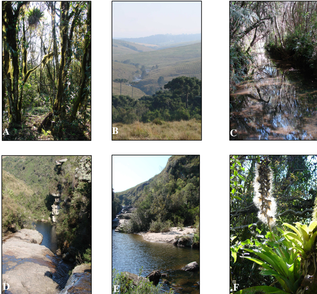
Figura 1. Áreas de estudo. A: cabeceira; B: em primeiro plano, floresta da foz do rio Bugio; C: foz do rio Bugio; D: vista geral do cânion; E: área de estudo no cânion; F: Vriesea platynema com sementes.

A segunda área localiza-se na foz do primeiro grande afluente do rio Tibagi, rio Bugio, em 900 m de altitude, onde a floresta se desenvolve em encosta, com declividades da rampa entre 8 e 20% (ondulado) (Figuras 1B e 1C). As declividades longitudinais do rio são superiores às anteriores, conferindo um ambiente de maior energia. As margens fluviais são constituídas por Neossolos Flúvicos, gradando rapidamente para Cambissolos Háplicos e Neossolos Litólicos. Os indivíduos arbóreos da floresta dessa área apresentam o maior porte dentre as áreas estudadas, com um indivíduo de Araucaria angustifolia que alcançou 17 m de altura e 88 cm de diâmetro. As espécies mais comuns pertencem à Myrtaceae, Euphorbiaceae, Rubiaceae e Lauraceae, representadas especialmente por Myrcia pulchra Kiaersk., Sebastiania commersoniana (Baill.) L. B. Sm. & Downs, Coussarea contracta (Walp.) Müll. Arg. e Nectandra grandiflora Ness & C. Mart. ex Ness.