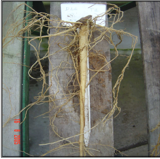
Figura 7. Raiz pivotante da mamoneira atrofiada em resposta ao estresse anoxítico (densidade do 1,6 g/cm 3 )