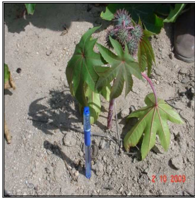
Figura 1. Planta que por estresse anoxítico, se desenvolveu, sem ter crescido.