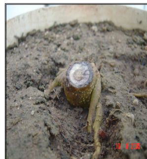
Figura 6. Raiz da mamoneira em resposta ao estresse anoxítico (densidade do solo: 2,0 g/cm 3 ).