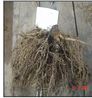
Figura 8. Raízes deformadas em virtude do impedimento físico do solo e surgimento de raízes adventícias em resposta ao estresse anoxítico (densidade do 2,0 g/cm 3 )