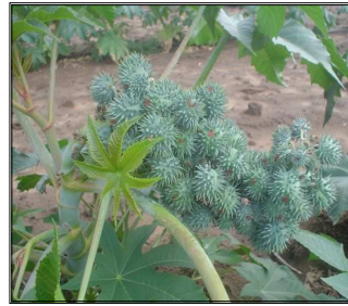
Figura 2. Cacho da mamoneira com curvatura devido ao estresse hipoxítico na sua formação.