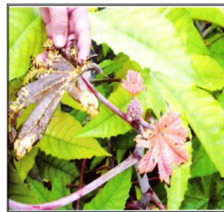
Figura 4. Folhas de mamoneira amareladas e com crestamento e necrose decorrentes do estresse anoxítico.