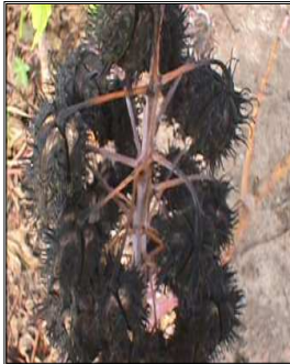
Figura 3. Cacho de mamoneira perdido por causa do estresse anoxítico nas raízes.