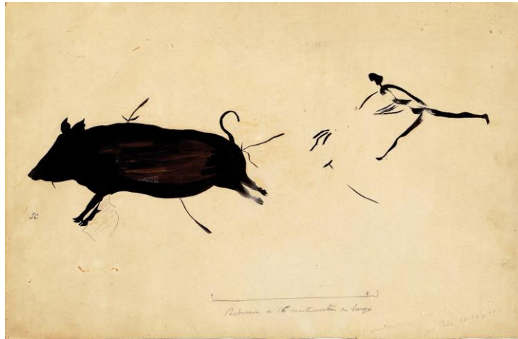
Escena de caza en la parte izquierda del mural del Val del Charco del Agua Amarga, en Valdealgofra, Teruel. Juan Cabré Aguiló, 1914. Tinta china sobre papel de gramaje alto. Sig.: ACN90B/002/01379.