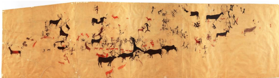
Mural completo de la Cueva de la Vieja en Alpera, Albacete. Juan Cabré Aguiló, 1911. Aguada en color sobre papel vegetal. Sig.: ACNARMARIO/27.

El día 22 de mayo se clausuró en el MNCN la exposición “Arte y Naturaleza en la Prehistoria. La colección de calcos de arte rupestre del MNCN”. Con una asistencia de más de 160.000 visitantes, puede ser considerada como una de las más exitosas de los últimos años.