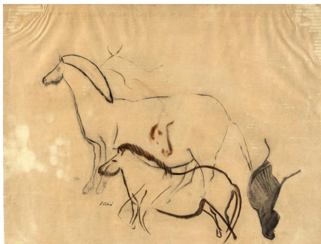
Caballos del Camarín. Cueva de la Peña, en San Román de Candamo, Asturias. Juan Cabré Aguiló, 1915. Grafito y carboncillo sobre papel de gramaje alto. Sig.: ACN90A/001/00874.

En una ambientación elegante, diseñada al milímetro y contando con imágenes animadas que atraen al público infantil como al adulto, la exposición lleva al visitante a disfrutar de las primeras manifestaciones de arte de la humanidad, cuya expresión más antigua fue realizada en la roca de cuevas y abrigos que el ser humano habitó durante el paleolítico y que continuaría durante el neolítico, cobre, bronce y hierro. La perfección en la pintura de grandes mamíferos perfectamente adaptados al relieve rocoso, va simplificándose hasta llegar a una expresión artística muy sencilla que, desde sus inicios, es interpretada como escritura jeroglífica, por semejanza con lo que ocurría en otras civilizaciones como Mesopotamia o Egipto, siendo finalmente reconocido como un tipo de arte muy evolucionado. Por su sencillez en la expresión fue denominado arte esquemático.